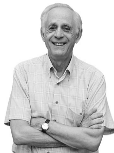
ANTONI COLL I GILABERT @Collgilabert

Estimaciones independientes calculan que hay cientos de muertos cada día, sobre todo rusos. Es la guerra de siempre, con bombas y con combates casa por casa. Jóvenes enviados a la muerte como por un mando a distancia.