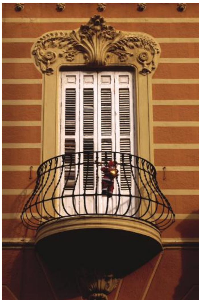
Enric Nieto, 1912. Wrought iron balcony of the former El Telegrama del Rif headquarters' building in calle Ejército Español 16

Enric Nieto i Nieto was an imaginative and precocious Barcelona architect, born between 1880 and 1883. Before moving to Melilla, he moved with the greats of Modernisme: his teacher was