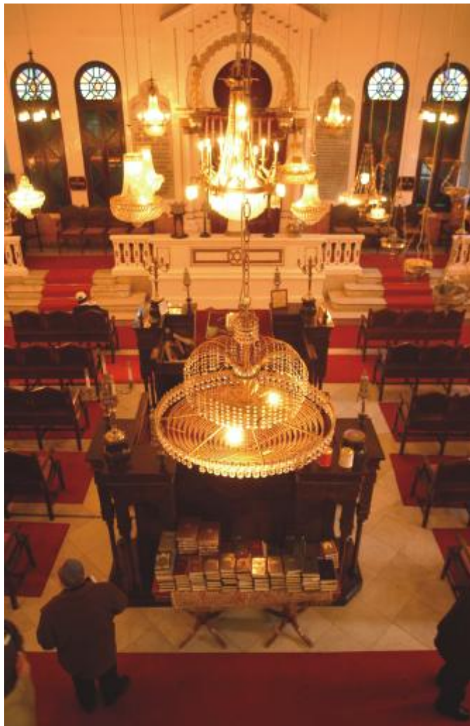
Enric Nieto, 1924. Interior of the Or Zoruah (Holy Light) or Yamín Benarroch Synagogue