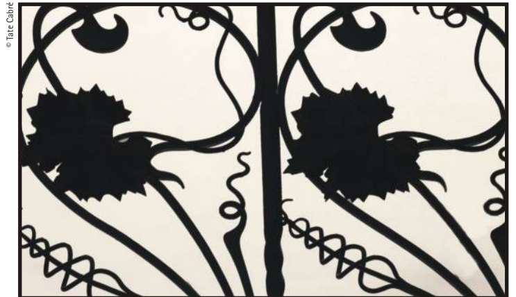
Detail of wrought iron bannister / Detall de barana de forja